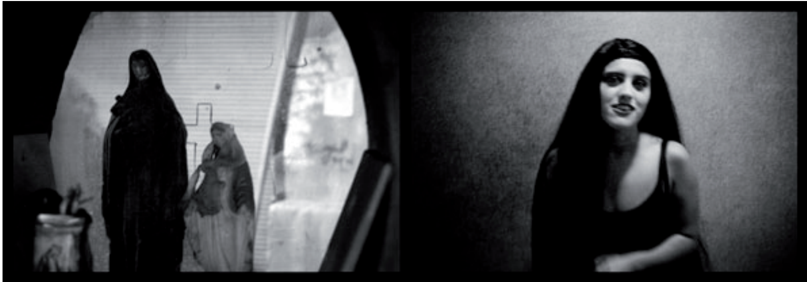
Sans titre, 2010, 25 × 70 cm,