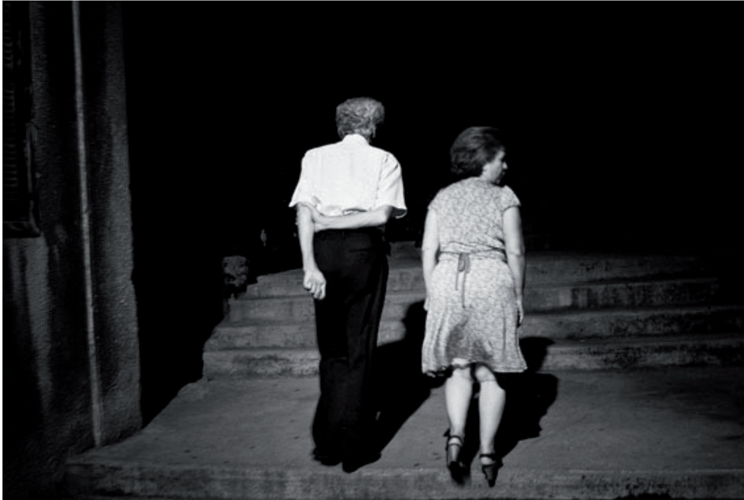
Sans titre, 2010, 50 x 70 cm