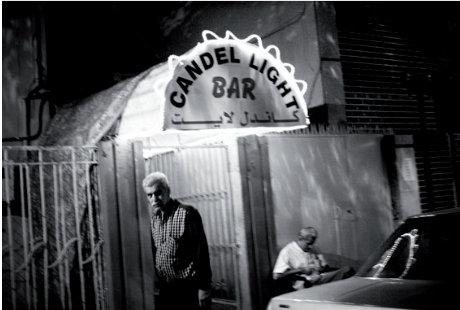
Sans titre, 2010, 21 x 28 cm