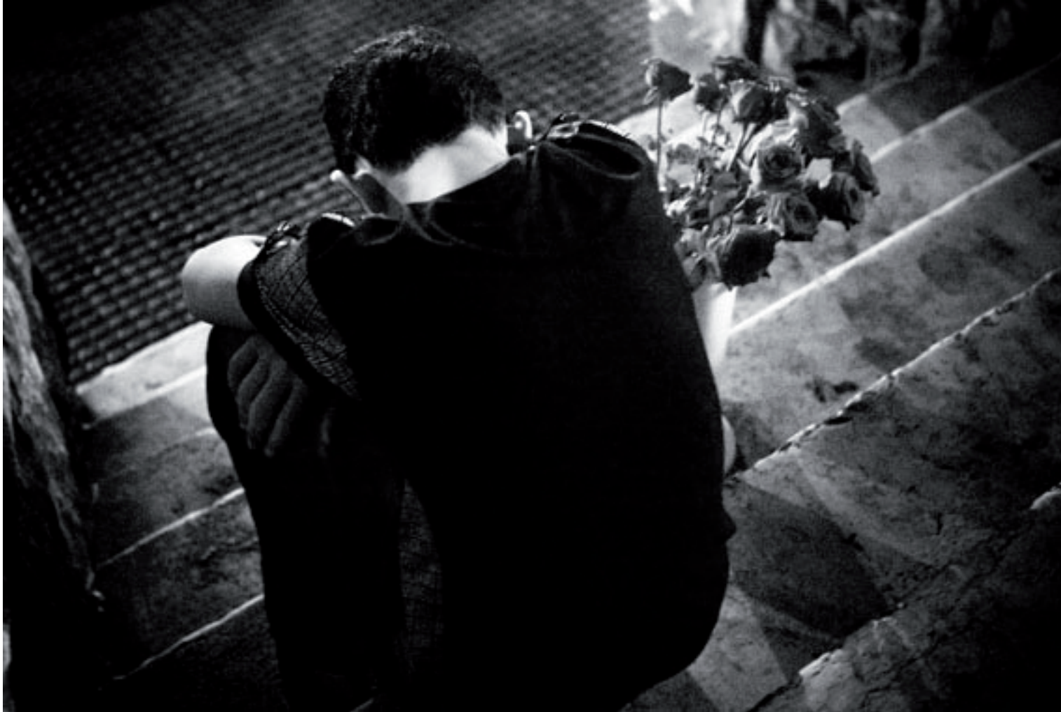
Sans titre, 2010, 21 x 28 cm