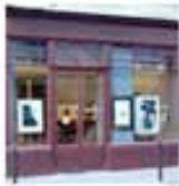
PHOTO4 4 RUE BONAPARTE • PARIS