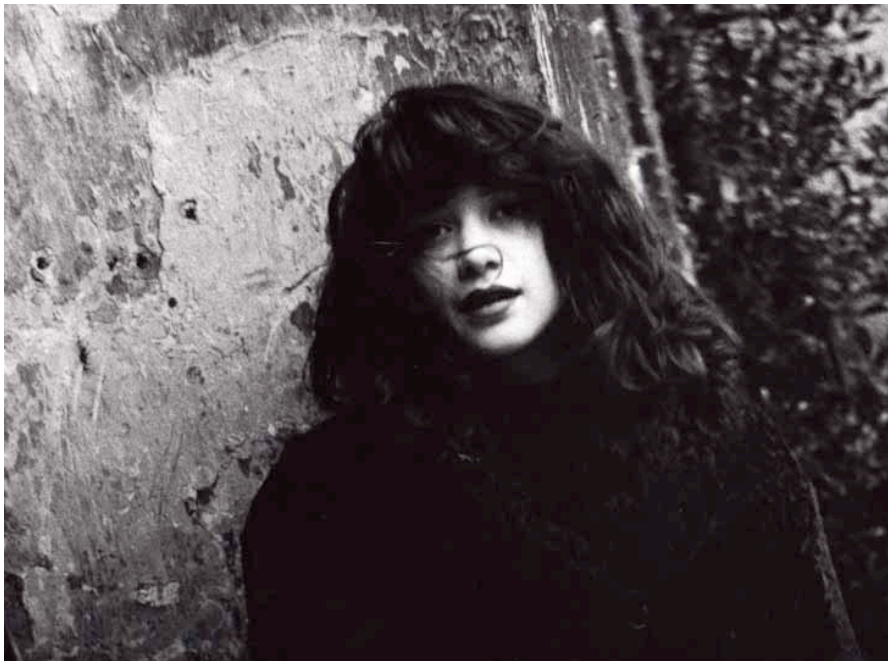
Vise, 1980, tirage argentique, 30 x 40 cm, Ed. 25 ex.

La première exposition parisienne de Mart Engelen Moments sera composée d'une sélection de 25 tirages argentiques, de différents formats, tous reproduits dans les trois ouvrages, Biarritz, Memories et My Dog Aapje publiés entre 2003 et 2006.