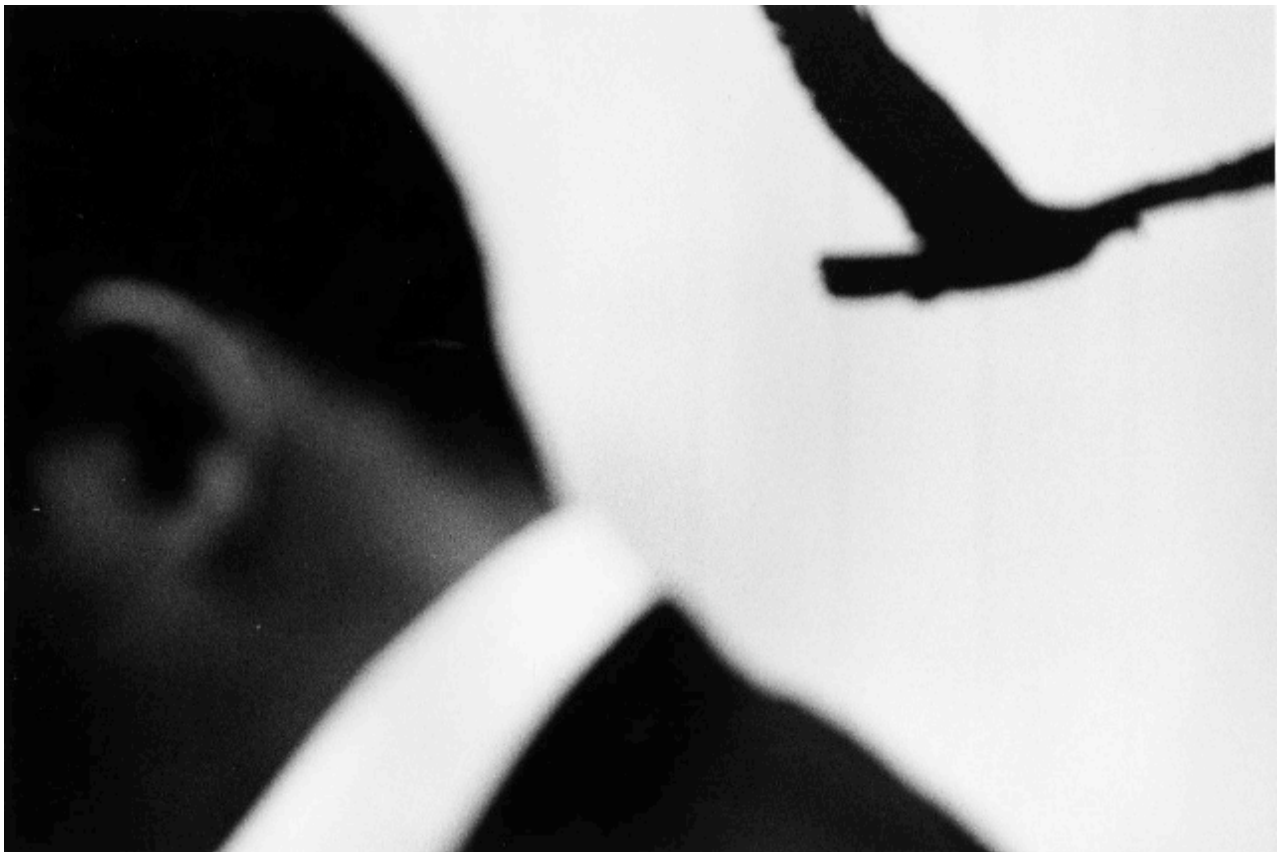
série « Tokyo Untitled », 2009, tirage argentique, 30 x 40 cm, édition 25 ex.